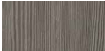
olmo fumè 4521